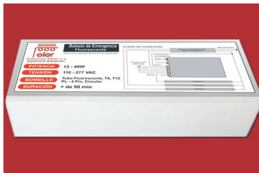
BALASTO PARA EMERGENCIA FLUORESCENTE