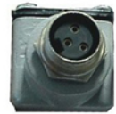
Conector Hembra Vista Frontal