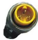
Conector Macho Vista Frontal